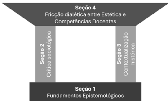
Figura 1. Estrutura do Livro

Por fim, seguindo a estrutura argumentativa dialética, o livro está estruturado em quatro capítulos. Para ilustrar o percurso lógico do texto, proponho a figura abaixo em forma de uma edificação, com alicerce, colunas e uma cobertura.