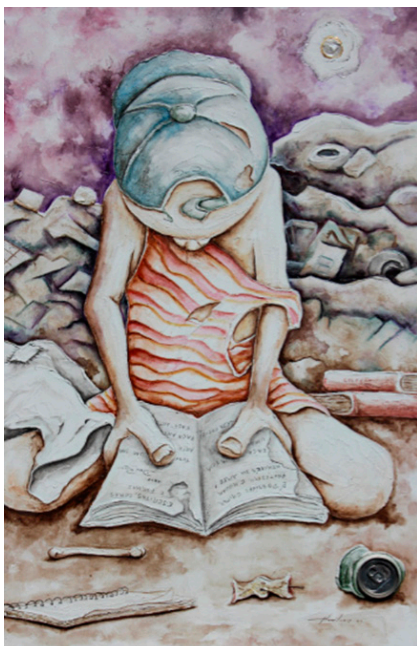
Figura 3. Obra “Lição de casa, que casa?”