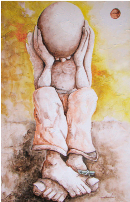
Figura 2. Obra “Grilado”