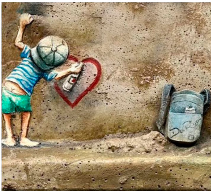
Figura 5. Obra “O muro que assiste a tudo!”