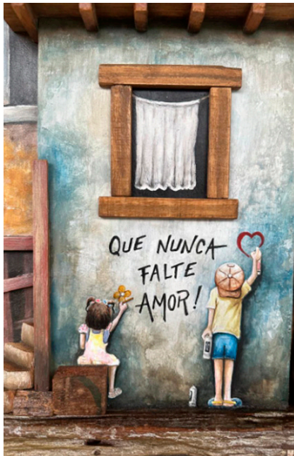
Figura 4. Obra “Pela cidade”.